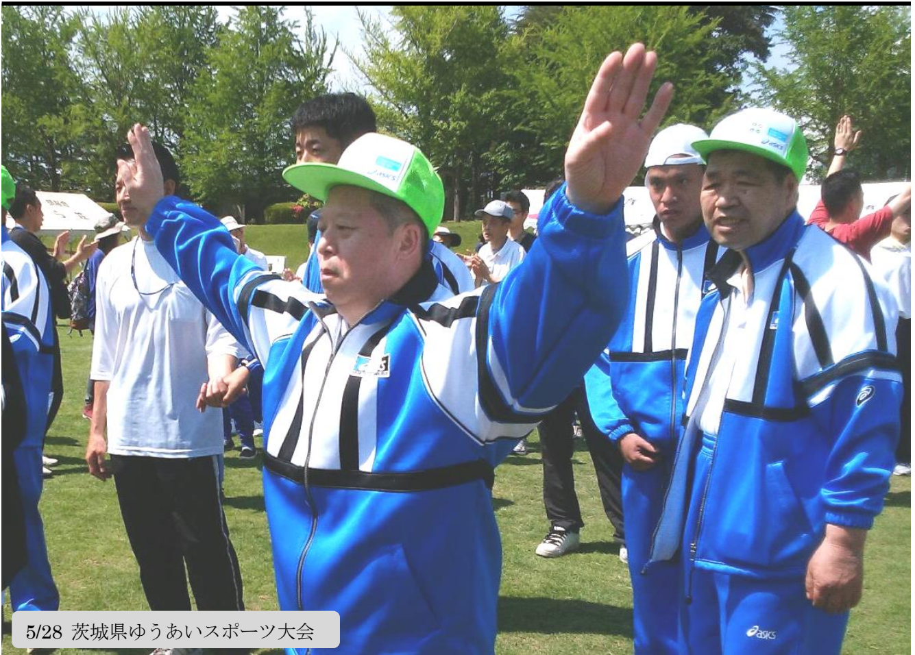
5/28 茨城県ゆうあいスポーツ大会