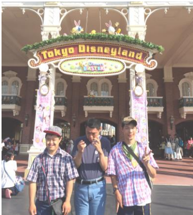
6/12 東京ディズニーランドにて

6月にはグループ別にドイツニーランドと歌謡ショーの外出がありました。ドイツニーランドでは、パレードを見たり、アトラクションを楽しんだりしました。歌謡ショーでは様々なアーティストの歌を聴き、レストランで食事を楽しみました。帰って来た利用者が口々に「歌謡ショー楽しかったよ」と笑顔で話してくれました。