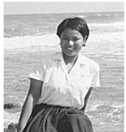
高校生の頃の私です

私が生まれた昭和27年は、ちょうど高度成長期に入る頃で、社会が目まぐるしく変わろうとしていた時代です。小学校から給食が始まり、家電製品も続々出てきました(白黒テレビ、扇風機、冷蔵庫、洗濯機)。小学校5年生の時、東京オリンピックが開催され、今でも日本の選手団が入場してきた様子をはっきりと覚えています。高校2年生の時、修学旅行で大阪万国博覧会へ行き、アメリカ館の「月の石」を猛暑の中3時間も並んで見学しました。中学、高校時代、英語が好きでその方向へ進学校たかったので、両親の猛反対で断念しました。 家が農家で一人娘の為、農家の専門学校へ進み施設園芸を専攻しました。 今まで自分の学生時代や人生を振り返る時間もなくて過ぎてきましたが、懐かしく思い出ができました。