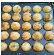
食べてくれ嬉しかった。私に有意義な時間をくれたことをとても有難く思うと同時にこれからも子ども達とおやつ作りをやっていききたいと思う。

に行っていた。今年も友達と旅行の計画を立てようと思っていた矢先にコロナウイルスの影響で行けなくなってしまったが、その分子ども達とおやつ作りを沢山行なった。ホットプレートで作れるおやつで、子ども達が飽きないようにと思うと中々難しく、頭を抱えてしまった。リクエストやインターネットの情報をかき集めホットケーキ・たこ焼き、大根餅・芋餅、餃子の皮でピザ、どら焼き（米粉を使用）等新しいものにも挑戦した。自分ではイマイチだと思えるものも子ども達は美味しいと食べてくれ嬉しかった。私に有意義な時間をくれたことをとても有難く思うと同時にこれからも子ども達とおやつ作りをやっていききたいと思う。