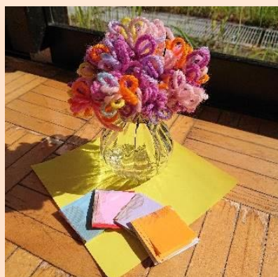
毛糸でお花、折紙でノート作りをして楽しく過ごしています。