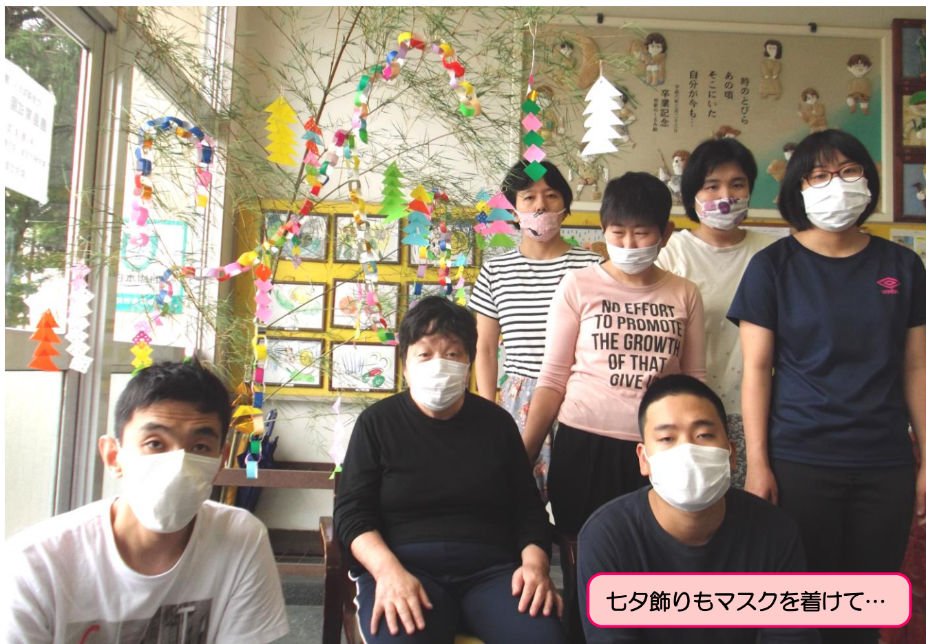
七夕飾りもマスクを着けて…