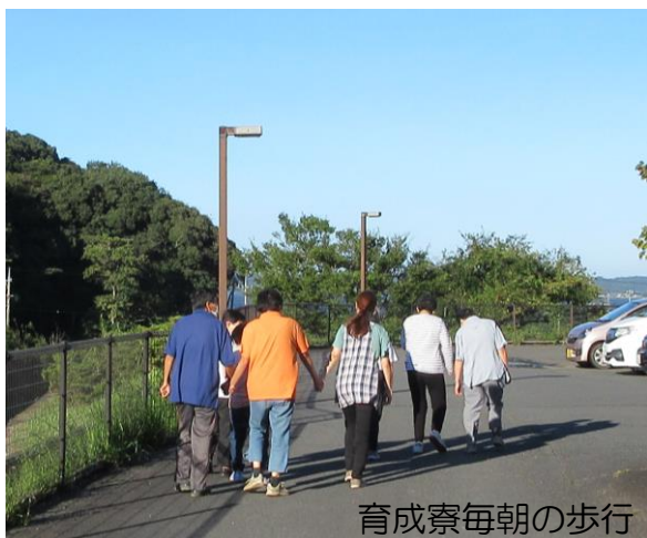
育成寮毎朝の歩行

やはり初めは出来なくても、声をかけ続けられれば、いつかできるようになる事が分かりました。これからも利用者さんに寄り添って気を長く支援して行きたいと思えます。