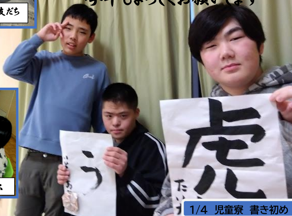
1/4 児童寮 書き初め