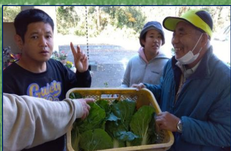
真冬の美味 鍋に欠かせない 白菜収穫！ 茨城・潮来市